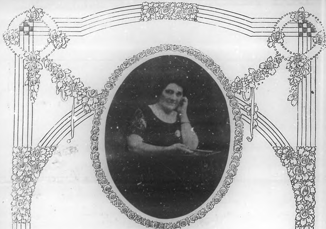
LA HIJA DEL CARIBE Notabilísima poetisa borinqueña.