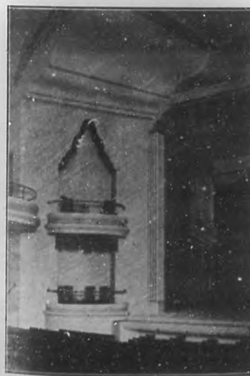
TEATRO "CARRAL".—Un detalle de la embocadura.

El más joven de los concertistas cubanos, el celebrado Pepito Echániz, interpretará varios números, entre los cuales se cuenta el