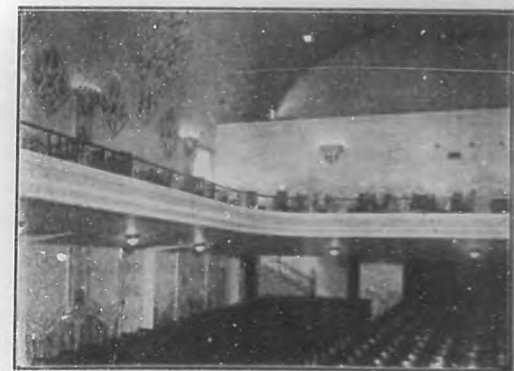
TEATRO "CARRAL".—El patio de lunetas.

nes de la Cinematografía. Las tandas elegantes de los Jueves y Domingos a las cinco de la tarde se ven concurrenciosas.