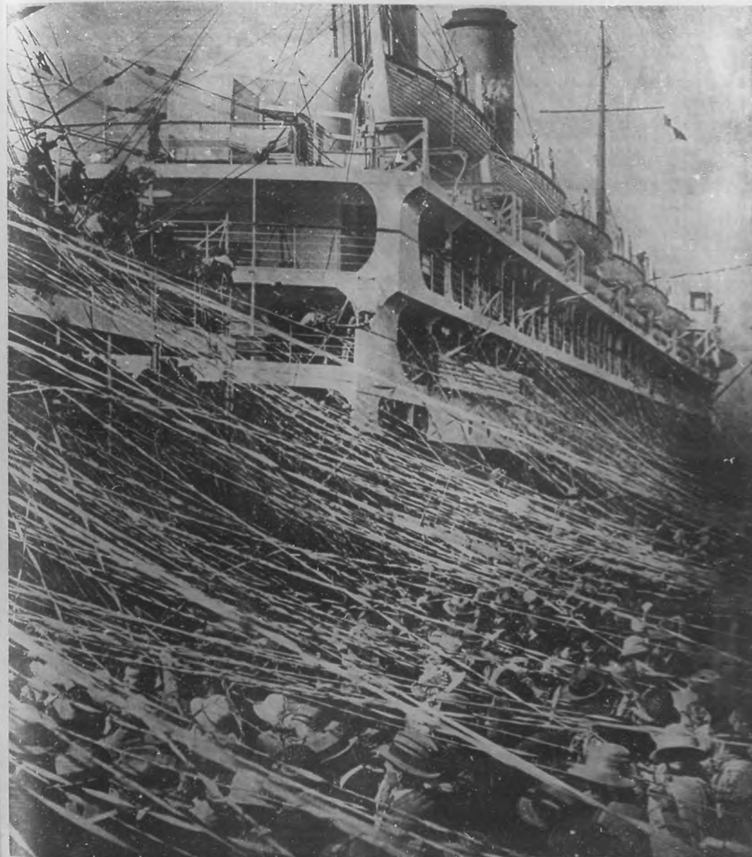
LA DESPEDIDA A LOS ATLETAS AUSTRALIANOS

Redacción, Administración y Talleres: Edificio de BOHEMIA, América Artes (antes Trocadero) números 59, 61 y 63. Teléfonos: Dirección, M-1392; Administración, A-2628.