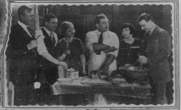
Principales actores de la película "Bread" (Pan)