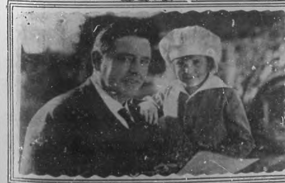
El tenor John Mc Cormack y el simpático Jackie Coogan

La acción se desarrolla en Nueva York, tomando parte en el "role" de la película casi toda la maquinaria policíaca de la Babal de Hierro.