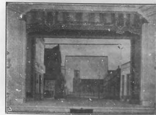
TEATRO "CARRAL".—El escenario.

En estas páginas publicamos varias fotografías para que el lector pueda darse perfecta cuenta de la magnitud y belleza de esta obra que engrandece a Guanabacoa.