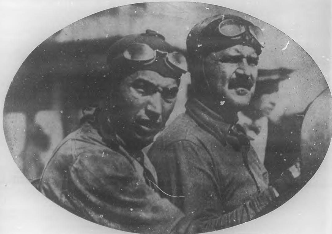
Luis Chevrolet, el famoso "driver" que tomará parte en las carreras automovilísticas que se efectuarán el 7 de Septiembre.

LAS PROXIMAS CARRERAS DE AUTOMOVILES. — DEMPSEY, ACTOR CINEMATOGRAFICO POR MICHAEL